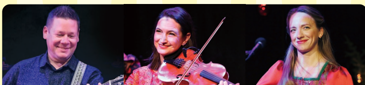
マグヌス・スティネルボム (ギター) Magnus Stinnerbom (Guitar)